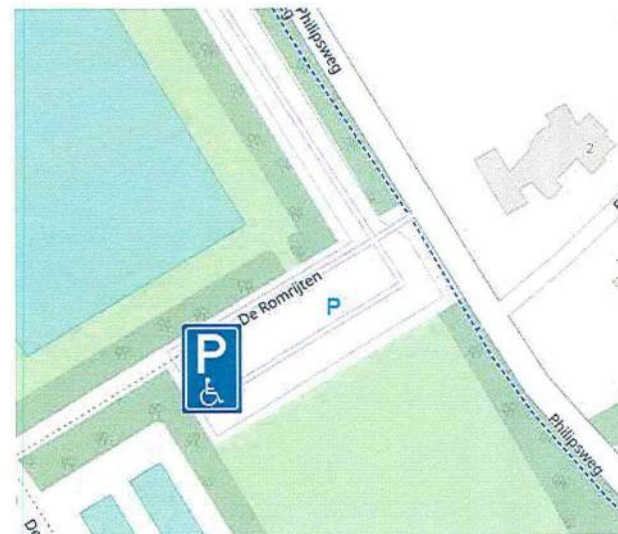
Sportpark de Romrijten (2plaatsen)