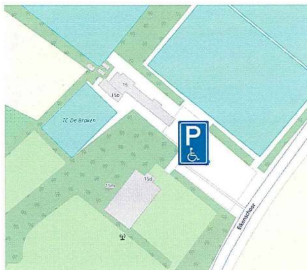
Sportpark de Branten (2plaatsen)