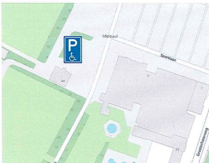
Sportlaan Budel (2plaatsen)